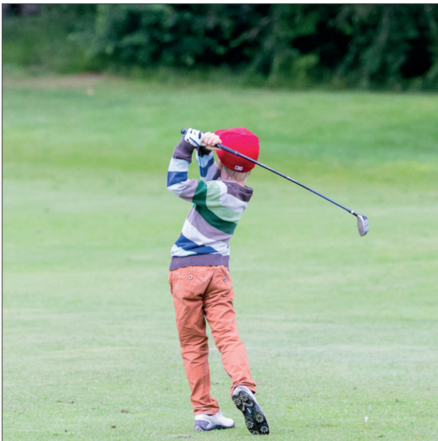
▲ Kuvateksti tähän.