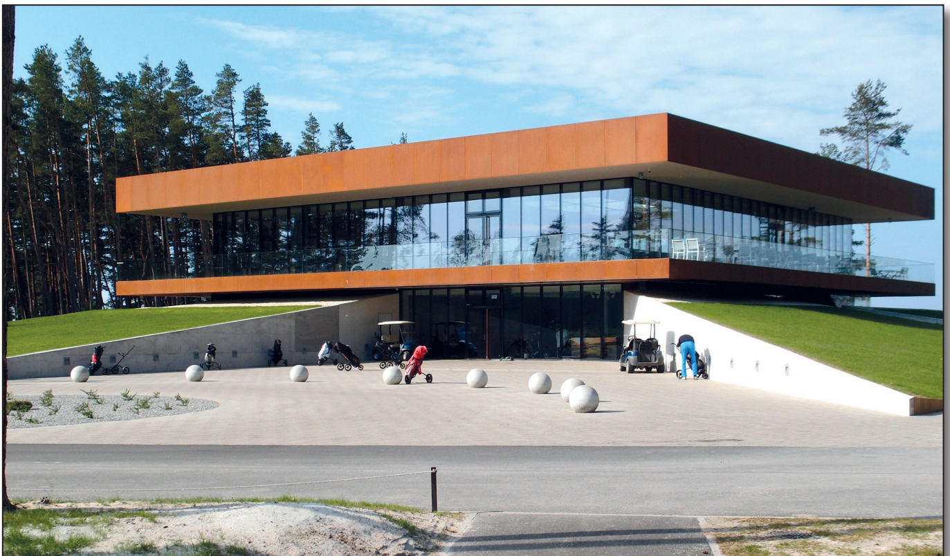
▲ Pärnu Bay Links.

Hotellin runsaan aamiaisen jälkeen siirryttiin tosi toimiin. White Beachin klubirakennus todettiin asialliseksi ja toimivaksi. Kukaan ei jäänyt kaipaamaan vanhaa kioskia pikku terasseineen eikä ojan reunalla kaa-