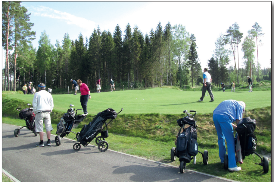
▲ Harjoittelua ennen kisa Pärnussa.

Kevätmatka suuntautui jälleen Vi- roon ja siellä erityisesti Pärnuun, jonne oli avattu uusi kenttä Pär- nu Bay Links ja sinne vanhemmal- lekin kentälle White Beach Golfille