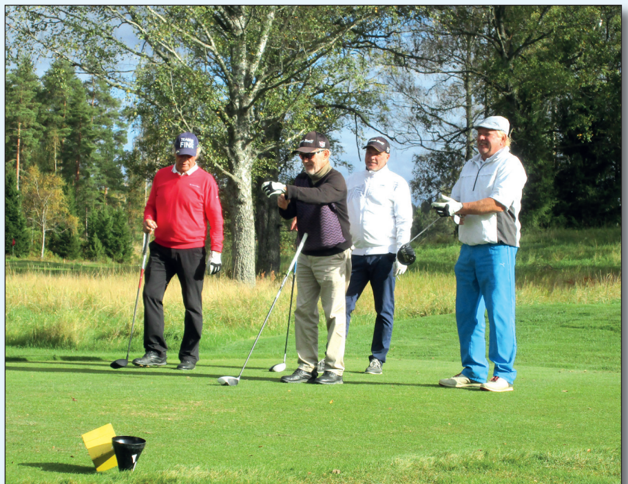
▲ Ryder Cup alkakoon.

Tylyt olivat luvut kuitenkin taiston tauottua. 25 pelaajan pisteet laskettiin yhteen ja kotkalaiset keräsivät bägeihinsä niitä 771. Meille jäi vain rippeet eli 617. Kun kotkalaisista viimeinen mukaan laskettu pelasi 27 niin sen tai enemmän kerä-