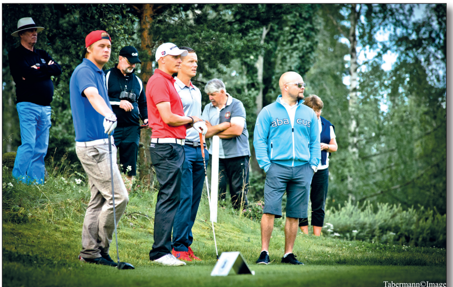
▲ Kuvateksti tähän.