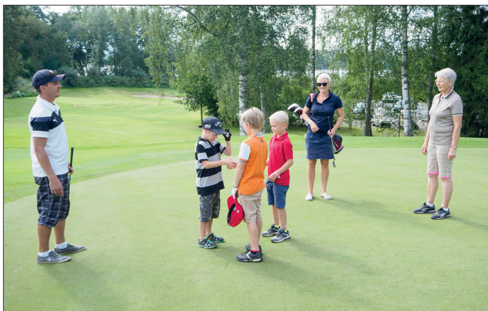
▲ Kuvateksti tähän.