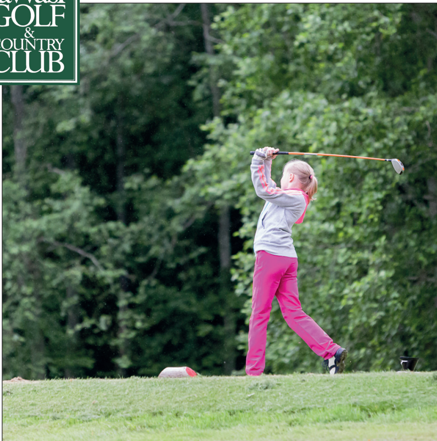
▲ Kuvateksti tähän.