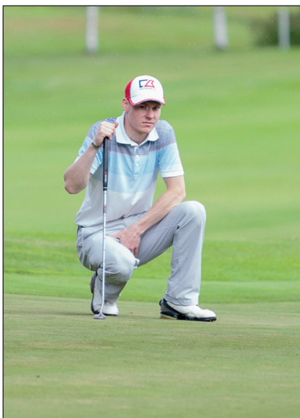
▲ Kuvateksti tähän.