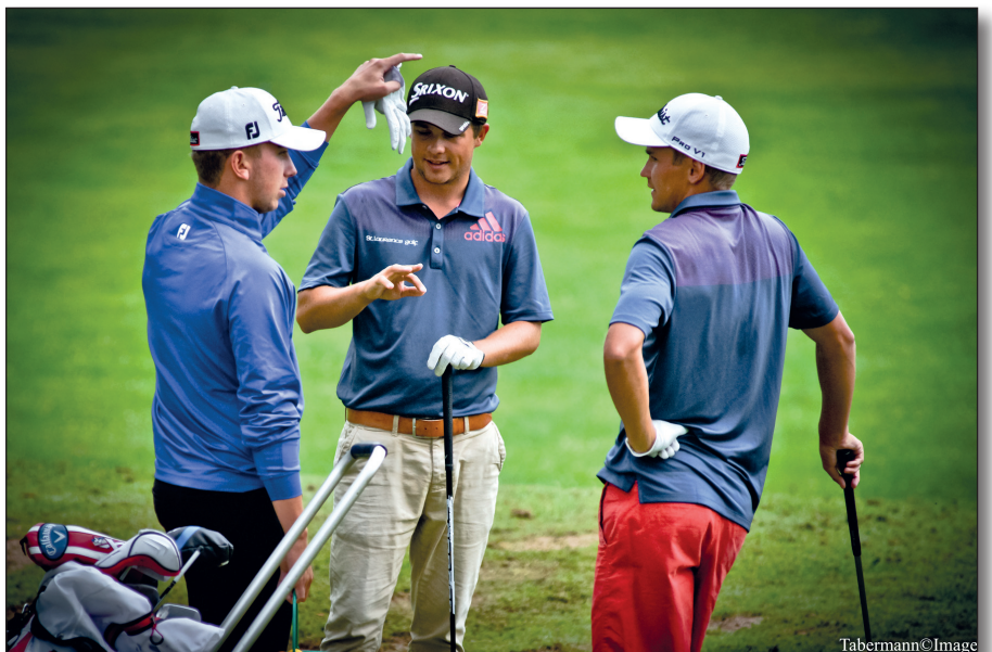
▲ Kuvateksti tähän.