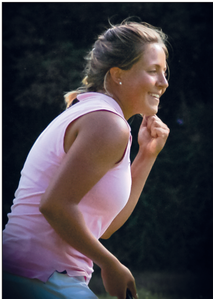
▲ Kuvateksti tähän.