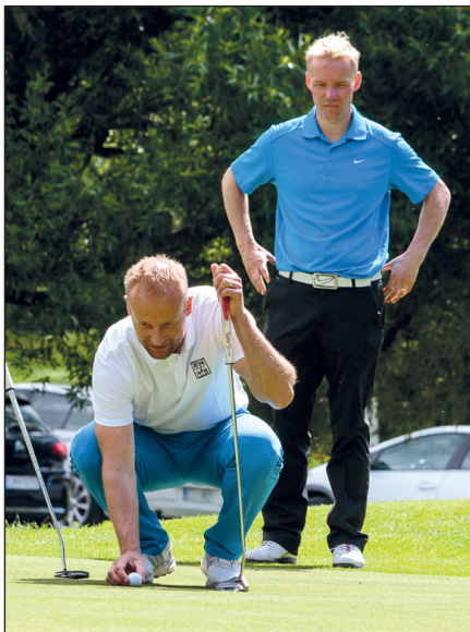
▲ Kuvateksti tähän.