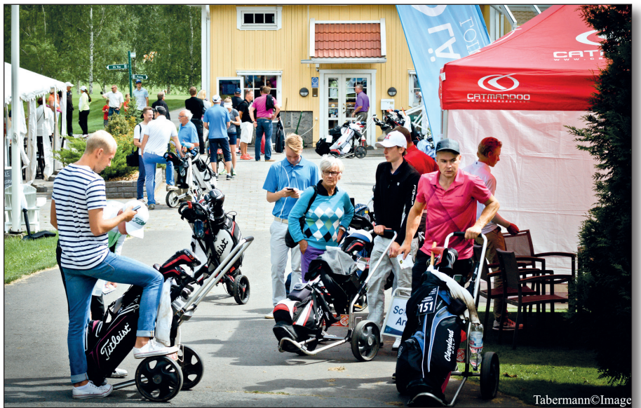
▲ Kuvateksti tähän.