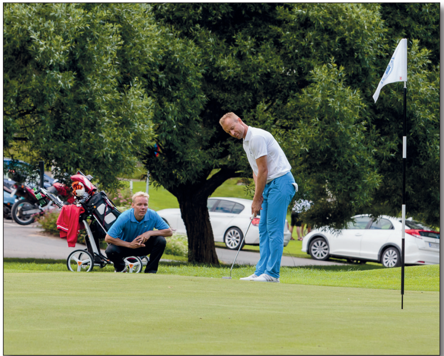
▲ Kuvateksti tähän. Kuvateksti tähän.