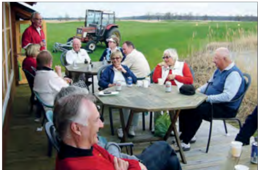
White Beach Golfin 19. reikä Aina eivät puitteet ole niin hulpeat mutta se tunnelma!

kerroksessa ja sinne johti erittäin jyrkät ja hankalat rappuset. Ei siinä mitään virkeänä ja päivänvalossa, mutta kun seniori-ikäisten täytyy aina välillä vähän jaloitella yöaikaankin, niin ilmeinen vaaran paikka oli olemassa. Varovaisuutta noudattaen selvittiin ilman onnettomuutta, mutta jäipähän tämä mieleen mahdollista seuravaa kertaa varten. Rivitaloihin