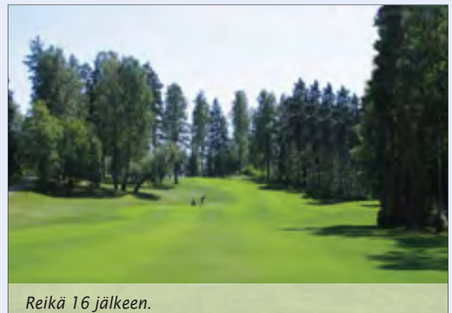
Reikä 16 jälkeen.