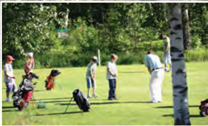
Junnukoulu järjestettiin kesäkuun alussa, mukana oli taas kymmeniä innokkaita junioreita tutustumassa golfiin.