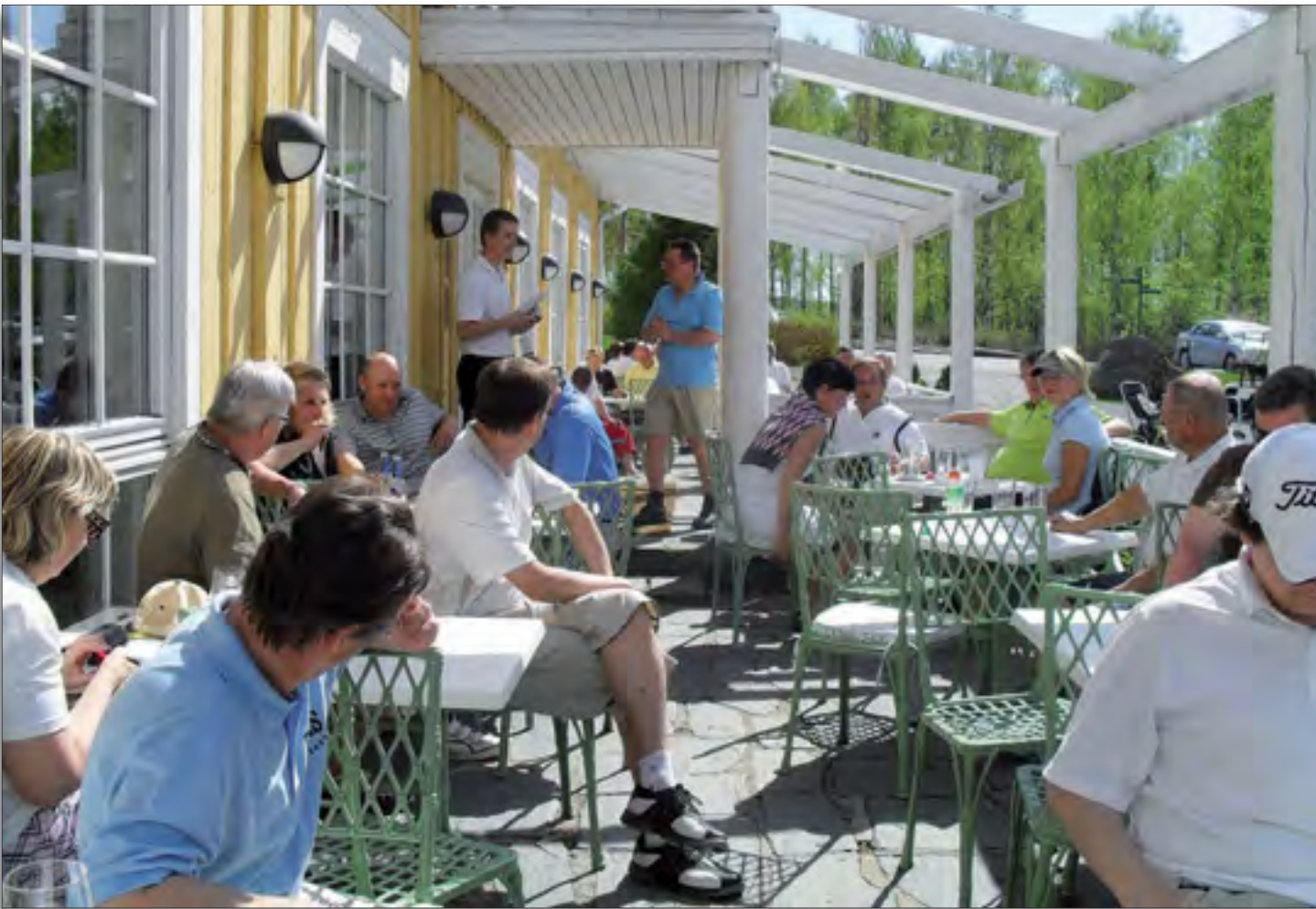
Tomaattia!Tomaattia! Golf -kilpailun palkintojenjako aurinkoisella terassilla 15.5.2010.