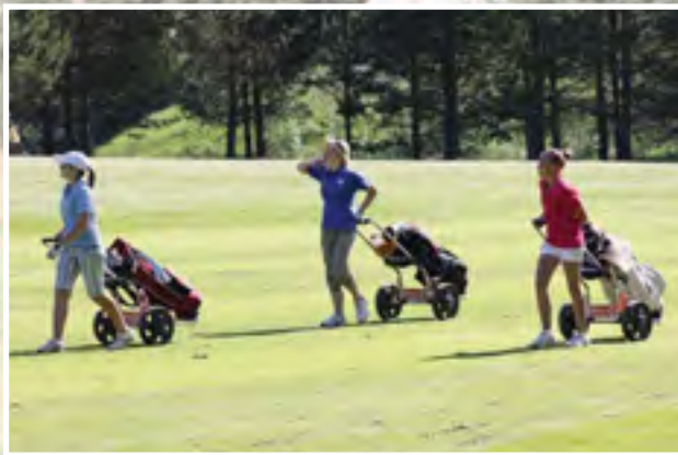
Juniorit täyttivät kentän Tsempitourissa 10.6.