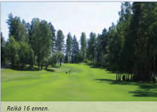
Reikä 16 ennen.