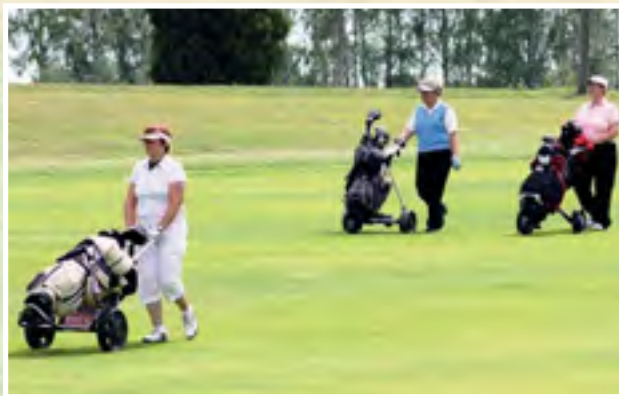
Naisten Senioripokaalit pelattiin 18.-19.6., ensi vuonna on sitten miesten vuoro.