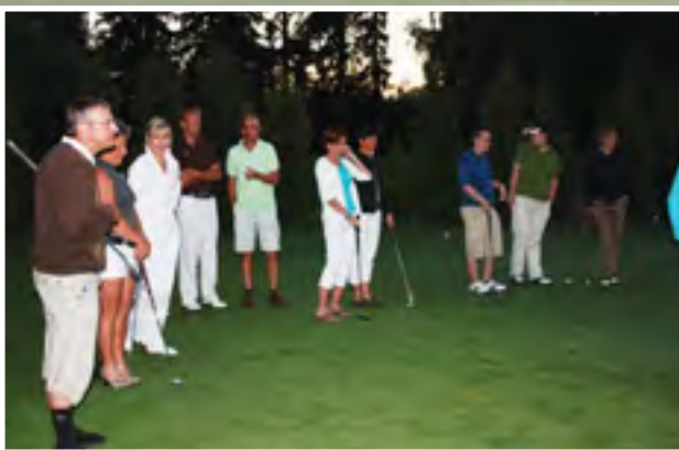
Juhannus -golfissa 24.6. järjestettiin myös se legendaarinen putti-kilpailu.