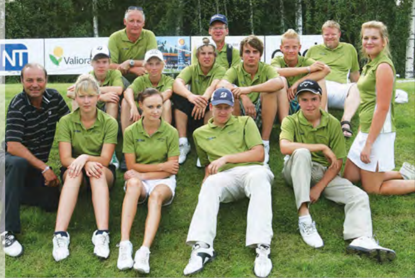
Tawastin juniorit joukkue-SM-kilpailussa Pietarsaassa.