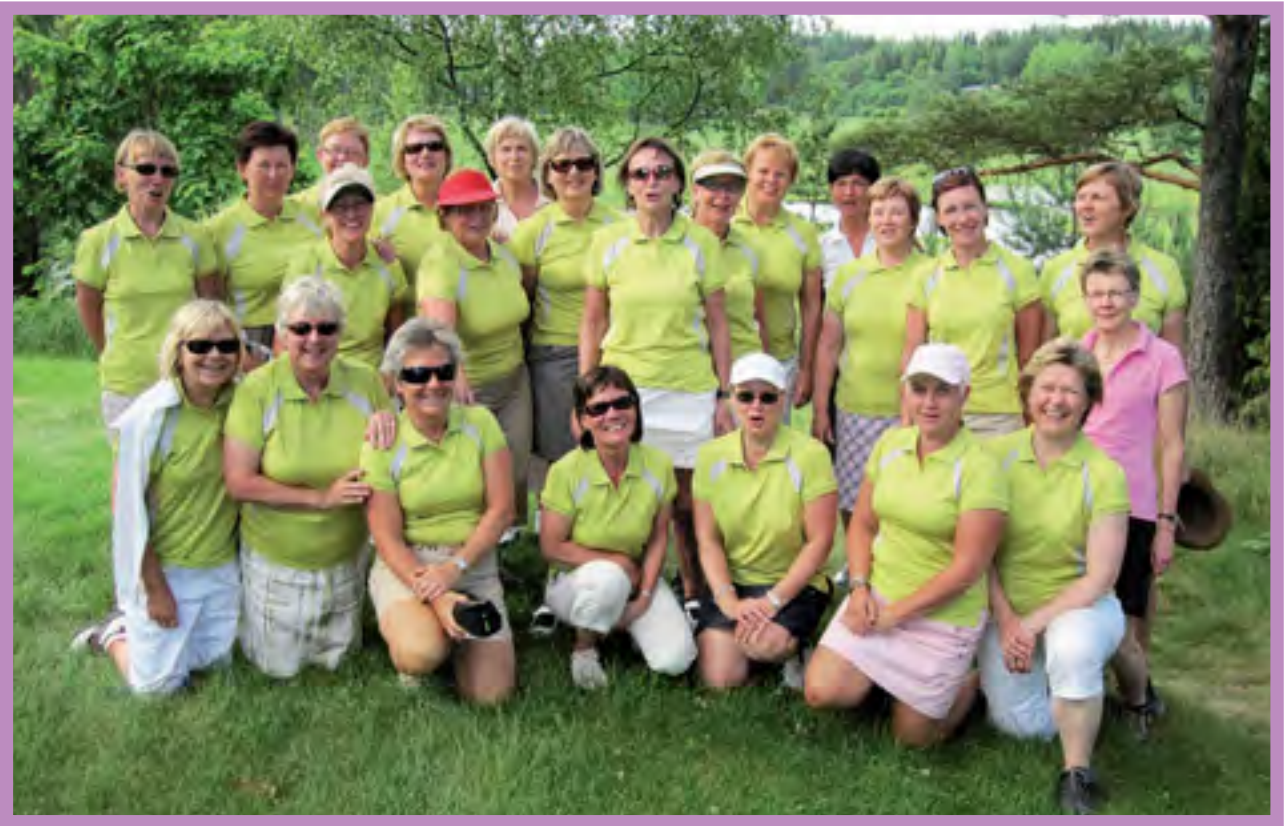
Haikon kesäretkeläiset ryhmäkuvassa.