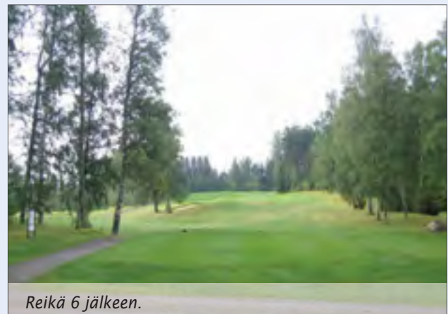
Reikä 6 jälkeen.