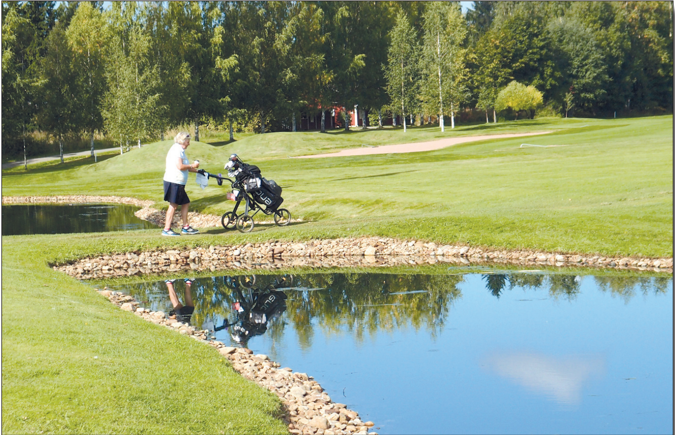
▲ Ritva Saarenkanta 10. väylällä.