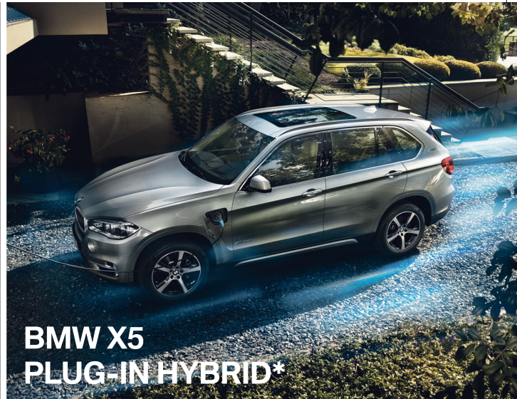
BMW X5 PLUG-IN HYBRID*