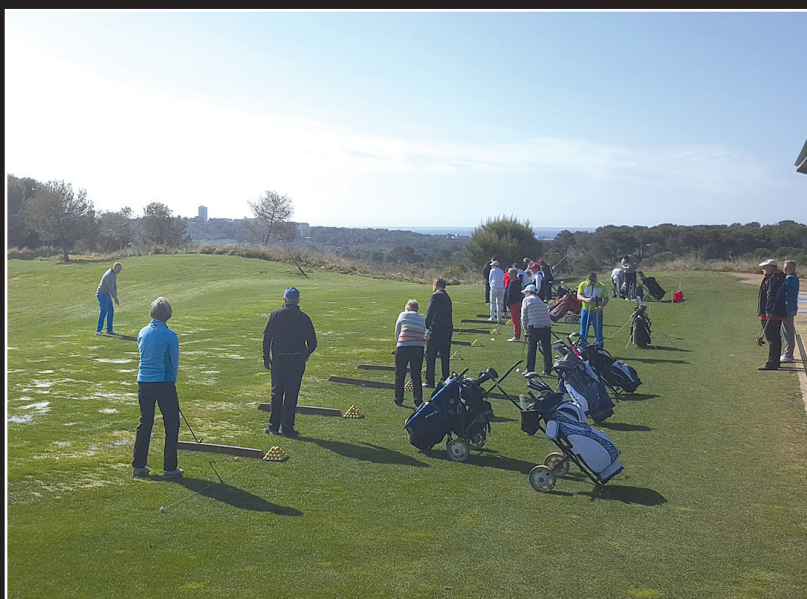
Olli Tapolan harjoitukset käynnissä Lumine Hilssillä.