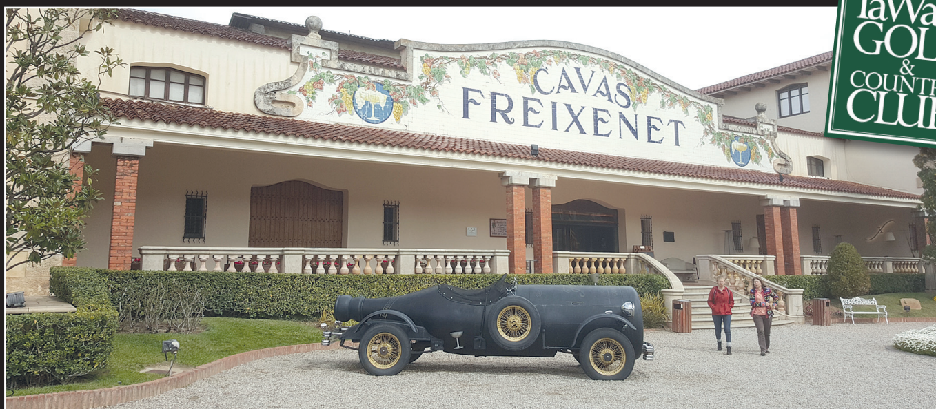
Matkalla oli muutakin nautittavaa kuin golf.