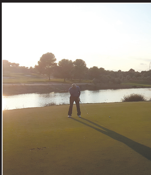
Lumine Ruins ja päivän viimeinen putti.