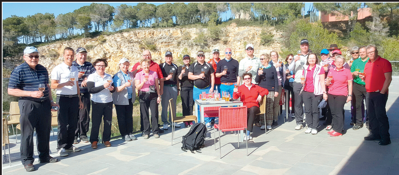
Viikon viimeinen kierros takana ja aika ottaa birdie-maljat.