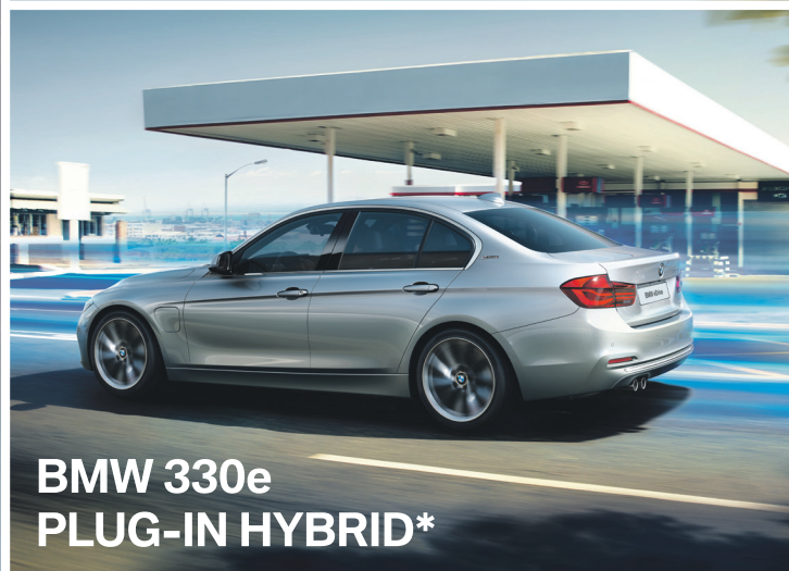
BMW 330e PLUG-IN HYBRID*